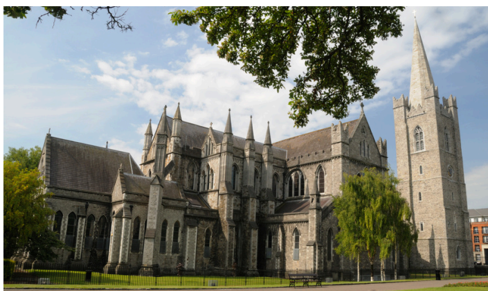
St. Patricks Cathedral Dublin

Flug von München nach Dublin. Vom Flughafen aus starten Sie gleich zu einer ersten Stadtrundfahrt. Anschließend haben Sie noch Zeit einen Snack einzunehmen. Am Anfang einer Reise durch Irland sollte man immer mit einem Guinness anstoßen und genau dies werden wir tun, denn Guinness gehört zu Irland. Bereits 1759 gründete Arthur Guinness eine Brauerei und seither spielt das „Black Stuff“, das Stout Bier, eine wichtige Rolle im Leben der Dubliner. Erleben Sie bei der Besichtigung des Guinness Storehouse wie das legendäre Schwarzbier gebraut wird. Zum Abschluss des Rundgangs gibt es natürlich ein Pint. Genießen Sie dieses in der Gravity Bar mit einem großartigen Panoramablick auf Dublin. Anschließend Check-in im Hotel und gemeinsames Abendessen im Hotel. (A)